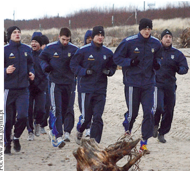
Dużo czasu w Cetniewie Arkowcy spędzają na plaży