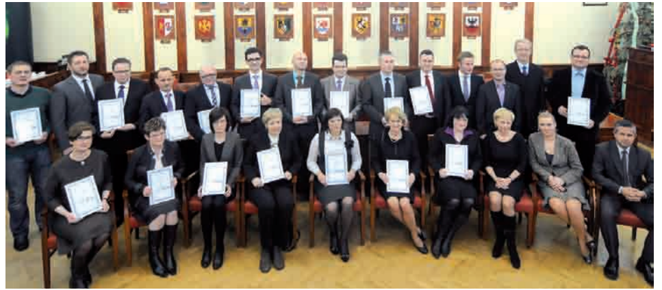
Pamiątkowe zdjęcie obecnych na uroczystości laureatów konkursu „Solidna Firma 2011”