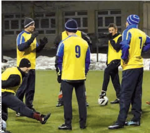
Podobnie jak w zeszłym roku zespół Ejsmond Club wydaje się faworytem Zimowego Pucharu Ligi GL6

- Grupa A i B mecze grupowe rozgrywać będzie w poniedziałki i czwartki, natomiast grupa C i D będzie, grać we wtorki i piątki – informuje