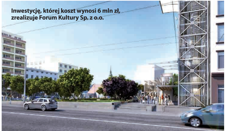
Inwestycję, której koszt wynosi 6 mln zł, zrealizuje Forum Kultury Sp. z o.o.

Inspiracją dla pomysłodawców gdyńskiego infoboxu były podobne projekty miastach Europy zachodniej. Zainteresowani planami na przyszłość Gdyni, mieszkańcy, turyści, ale również inwestorzy, będą mogli uzyskać w centrum wszelkie informacje dotyczące np.: rozbudowy Teatru Muzycznego, budowy nowej siedziby głównej banku Nordea i hotelu Marriott przy Sea Towers, rozbudowy PPNT, adaptacji lotniska Gdynia-Kosakowo do potrzeb ruchu cywilnego, Pomorskiej Kolei Metropolitalnej czy rewitalizacji obszarów portowych. Informacje przedstawiane będą w ciekawej, angażującej odbiorcę formie multimedialnej Interaktywna i dynamiczna dzięki zastosowaniu ekranów będzie sama fasada obiektu. W centrum znajdą się: salon prasowy, kawiarnia z tarasem i pawilony wystawowe. Niebanalny jest również sam projekt budowli zaprojektowany przez laureata licznych konkursów architektonicznych mgr inż. arch. Jacek Droszcza. Integralną częścią obiektu będzie 22-metrowa przeszklona wieża widokowa, na której można dostać się schodami lub panoramiczną windą. Teren