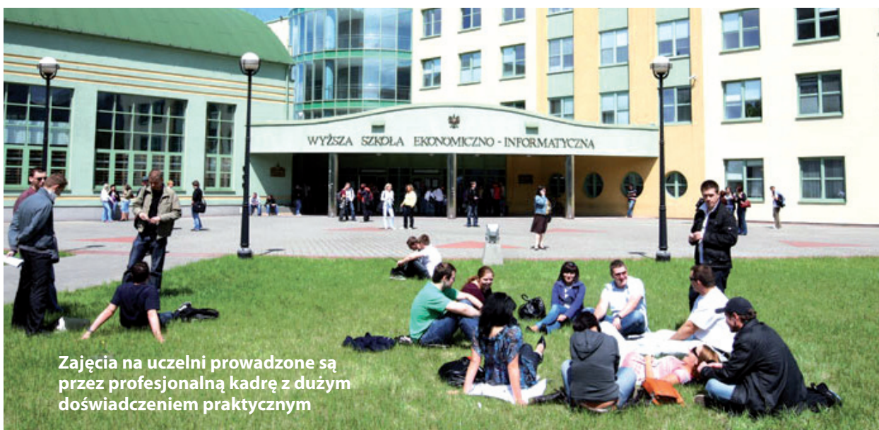
Zajęcia na uczelni prowadzone są przez profesjonalną kadre z dużym doświadczeniem praktycznym

>> NABÓR | 9 stycznia Uczelnia Vistula (dawniej Wyższa Szkoła Ekonomiczno - Informatyczna w Warszawie) rozpoczęła rekrutację na semestr letni studiów stacjonarnych i niestacjonarnych, I i II stopnia. Potencjalni studenci mogą kandydować na 8 różnych kierunków.