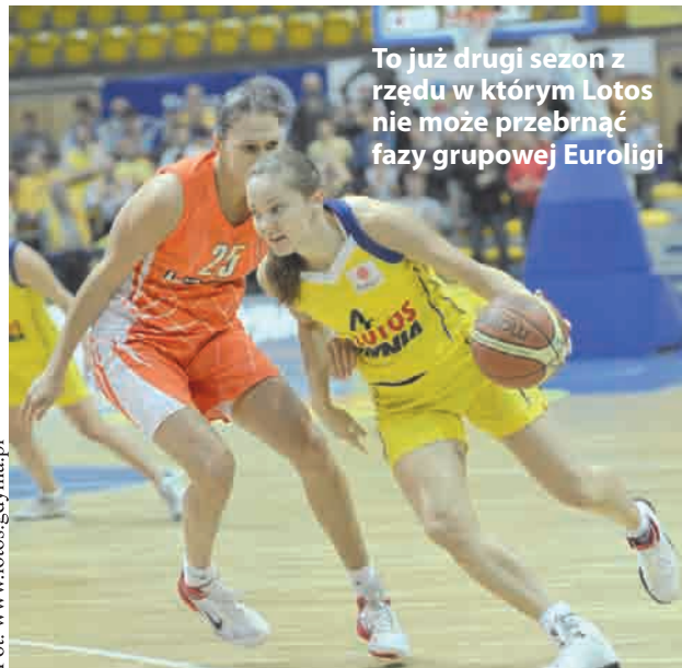
To już drugi sezon z rzędu w którym Lotos nie może przebrnąć fazy grupowej Euroligi

przedzić drużynom, które są zaraz za nimi w ligowej tabeli. Dzisiejsze spotkanie z Galatasaray Stambuł (początek godzina 17.30) będzie niezwykle trudne. W składzie rywalów aż roi się od gwiazd światowego formatu. Najlepsza koszykarka świata – Dia-