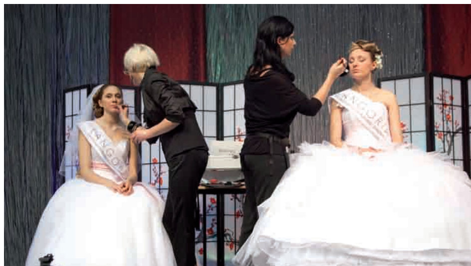
Pokazy najnowszych kolekcji sukien, garniturów i akcesoriów ślubnych. W jednym miejscu wszystko dla panny młodej, pana młodego, ich rodziców i świadków

>>> TARGI | Chcesz zobaczyć najnowsze trendy mody ślubnej oraz makijażu, posłuchać na żywo zespołów muzycznych czy popisów mistrzowskich par tanecznych przyjdź na IX Targi Ślub i Wesele.