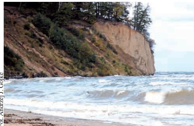
Szcątki odsłonił najprawdopodobniej sztorm

prasowy Komendy Miejskiej Policji w Gdyni. - Najprawdopodobniej pochodzą one z okresu II wojny światowej. Szkielety trafiły do Zakładu Medycyny Sądowej w Gdańsku, którego specjaliści będą to wszystko starali się ustalić. (ANGO)