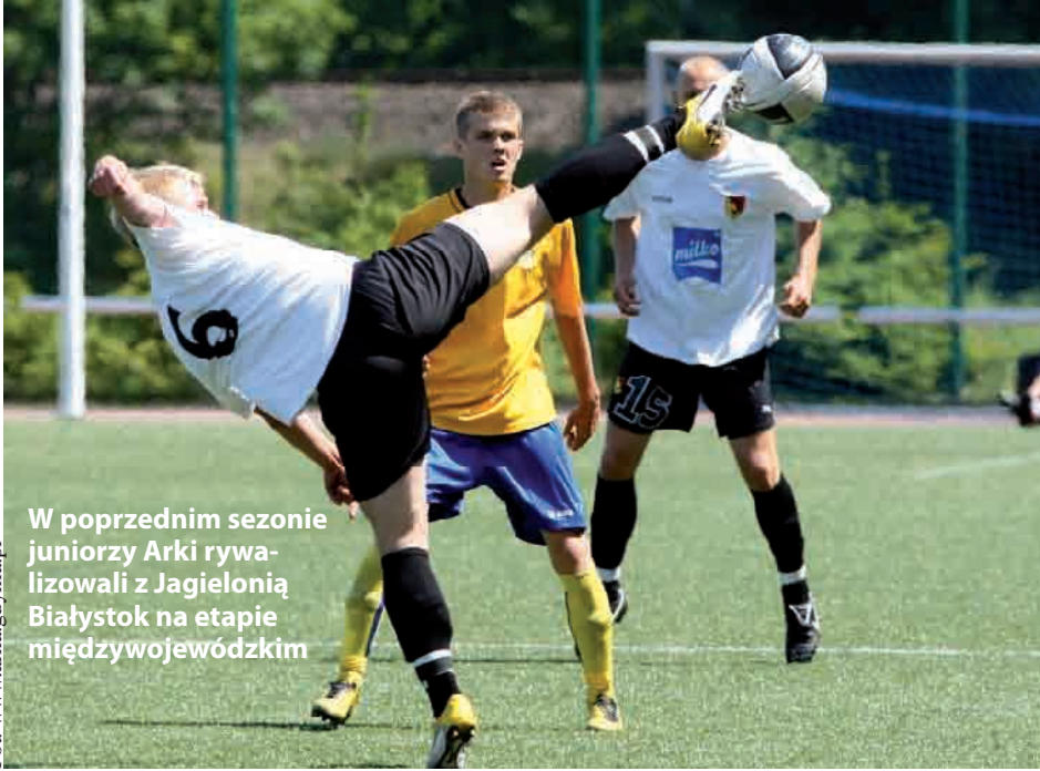
W poprzednim sezonie juniorzy Arki rywalizowali z Jagielonią Białystok na etapie międzywojewódzkim

Lista piłkarzy godnych polecenia jest długa. Najbliższe otrzymania szansy wydają się juniorzy starsi i juniorzy młodszy występujący, na co dzień w Pomorskiej Lidze Juniorów. Patrząc na tabelę można być dumnym z osiągnięć gdyńskich zawodników, ponieważ