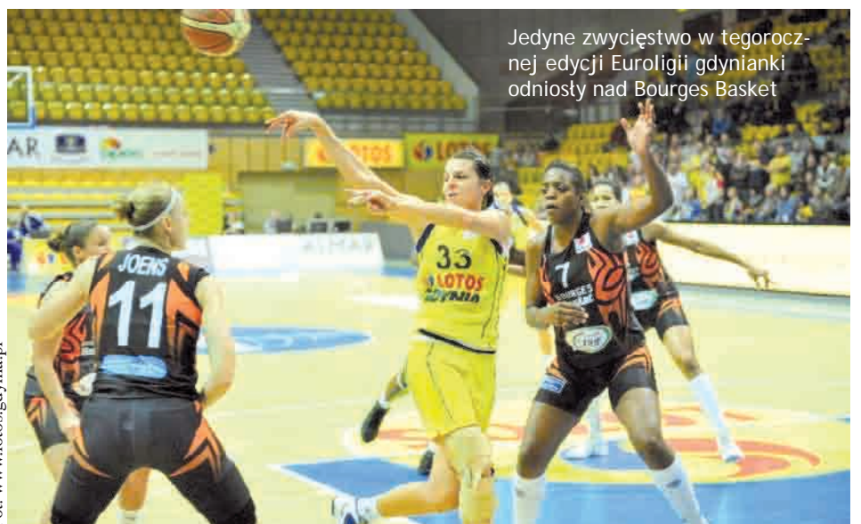
Jedynie zwycięstwo w tegorocznej edycji Euroligi gdynianki odniosły nad Bourges Basket

czy Rybnik to mamy szansę na odniesienie drugiego euroligowego zwycięstwa - komentowała dla oficjalnej strony internetowej klubu Anderson.