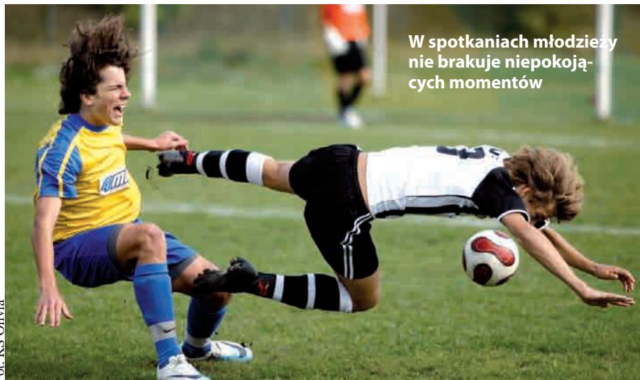
W spotkaniach młodzieży nie brakuje niepokojących momentów

W tych rozgrywkach fani Lechii i Arki mogą również dopingować piłkarzy w ulubionych trykotach. Młodzi koledzy profesjonalistów z Lechii i Arki zazwyczaj grają o najwyższe laury, także emocji będzie nie mniej niż w zawodowej piłce. Nie można również odmówić zaangażowania młodym piłkarzom. Dodając do tego bezpłatny wstęp na spotkania, w zamian można liczyć na dobre widowisko sportowe. Pomorska Liga Juniorów Starszych i Młodszych to inaczej ekstraklasa młodzieżowej piłki na poziomie regionalnym. To ostatni szczebel rywalizacji młodzieżowej, po którym najzdolniejsi mogą trafić do najlepszych polskich lub zagranicznych klubów. To również najlepsze miejsce do autopromocji piłkarskich „perełek”. Po