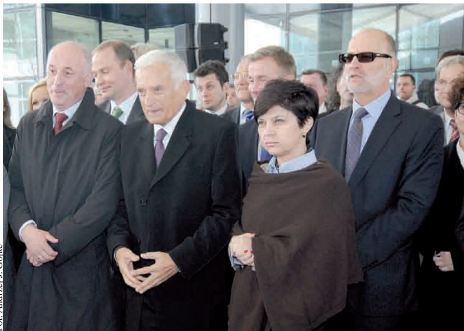
Nowy budynek GPNT