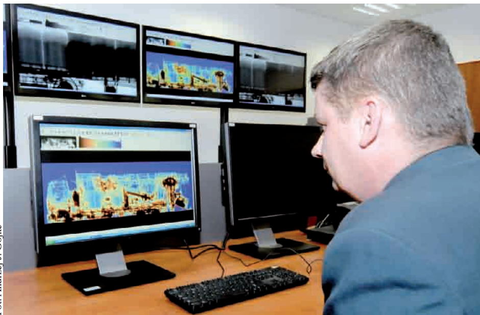
Sala analityczna, w której doświadczeni celnicy zajmują się analizą wykorzystania urządzeń rentgenowskich rozmieszczonych na kilkunastu przejściach granicznych w całym kraju