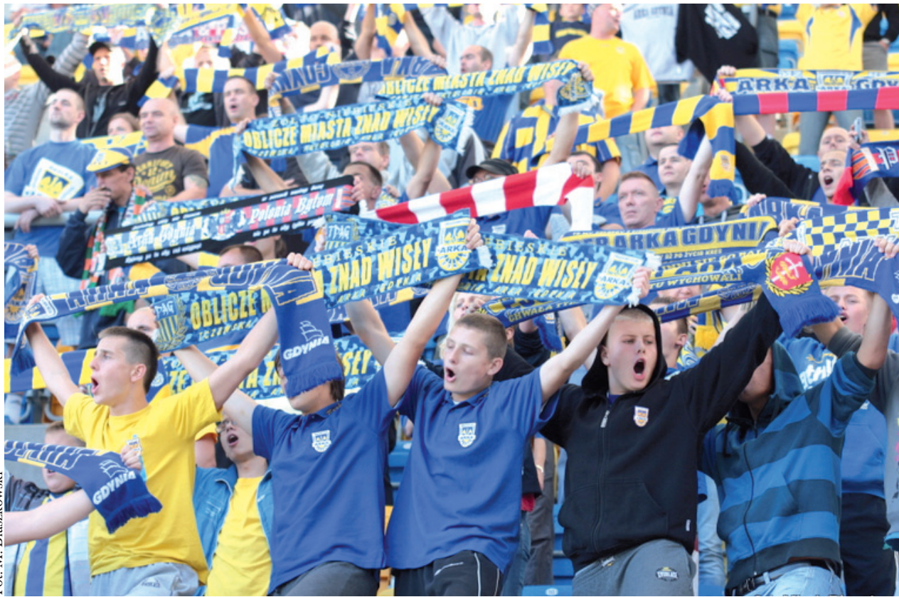
Zawodnicy liczą, że w sobotę kibice stworzą niepowtarzalną atmosferę

ZAPOWIEDŹ | Jeśli nad morze przyjeżdża lider I ligi to takie spotkanie należy określić jako hit kolejki. Nawet jeśli gospodarze na razie zajmują miejsce dalekie od ideału, taki mecz elektryzuje kibiców.