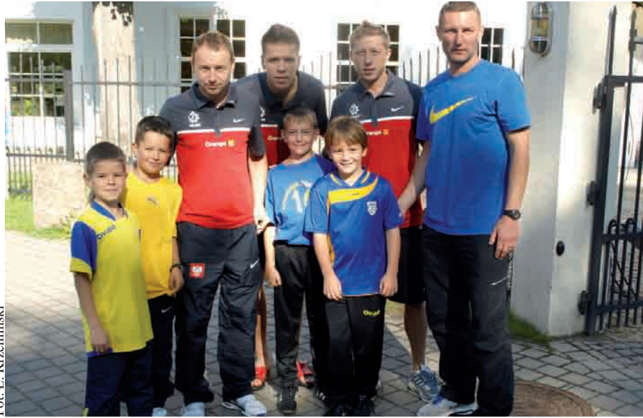
Adeptów Akademii Piłkarskiej 16 spotkali się z reprezentantami Polski: Wojciechem Szczęsnym i Rafałem Murawskim oraz trenerem napastników Tomaszem Frankowskim

AKADEMIA | Czterech adeptów Akademii Piłkarskiej 16 spotkało się we wtorek przed południem z reprezentantami Polski przebywającymi w Gdańsku.