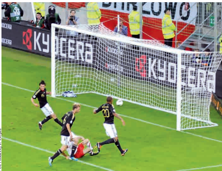
Fot. Andrzej J. Gojke

PIŁKA NOŻNA | Tak blisko pokonania reprezentacji Niemiec biało-czerwoni nie byli jeszcze nigdy.