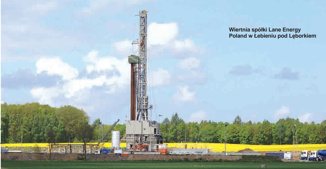
Wiertnia spółki Lane Energy Poland w Łebieniu pod Lęborkiem

- Odwiert Lubocino 1 został wykonany na Pomorzu w okolicach Wejherowa - informuje biuro prasowe PGNiG. - Wiercenie do głębokości 3,5 km zakończono w marcu 2011 r. W odwiercie tym, w łupkach sylurskich stwierdzono objawy gazu, ale obecnie trwają analizy danych oraz przygotowania do testów produkcyjnych. Jesie-