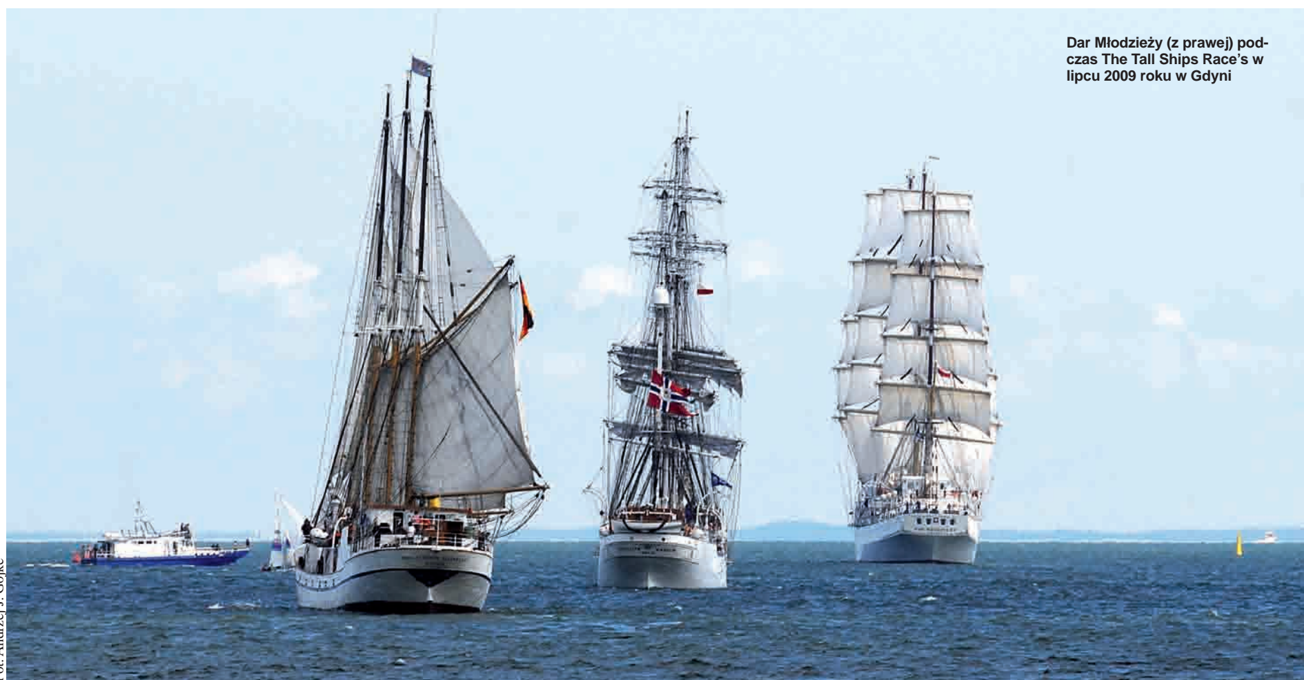
Dar Młodzieży (z prawej) podczas The Tall Ships Race's w lipcu 2009 roku w Gdyni

Na drugim miejscu jest rosyjski Mir płynący niespełna 24 mile za Darem Młodzieży. Walka między tymi fregatami będzie najprawdopodobniej toczyć się do ostatnich niemal chwil. Na dobry wynik w stawce nie ma już raczej szans Fryderyk Chopin. O podium walczyć będą chcieli także holenderski Gulden Leeuw oraz największy szkolny żaglowiec świata - Sedov. W klasie B liderem jest holenderska Tecla, pośród jachtów klasy C najszybszy na razie jest polski 4 Oceans' Dream, zaś w gronie najmniejszych jednostek klasy D prowadzi litewska Lietuva, której do mety pozostały już tylko 44 mile.