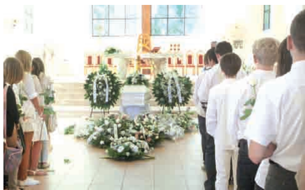
W kościele pw. Trójcy Św. i na cmentarzu komunalnym przy ul. Spokojnej odbyły się uroczystości pogrzebowe

Komendant wojewódzki policji w Gdańsku wyznaczył przed przed kilkoma dniami nagrodę w wysokości 10 tys. zł dla osoby złotych nagro-