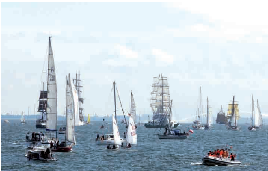
Podczas regat The Tall Ships Race's w lipcu 2009 roku

gorącego przyjęcia, jakiego doświadczył w Gdyni przed dwoma laty, światowe żeglarstwo, ponownie spotka się na zlocie w gdyńskim porcie i wodach Zatoki Gdańskiej już tydzień – w dniach 2 - 5 września. Krajobraz zatoki i basenu portowego nad którymi na co dzień górują wieże Sea Towers, na cztery dni zdominują wspaniałe żaglowce. Głównym celem zlotu The Culture 2011 Tall Ships Regatta jest promocja kultury krajów basenu Morza Bałtyckiego. Impreza pod egidą Sail Training International jest jednym najważniejszych wydarzeń uświetniających pełnię roli Europejskiej Stolicy