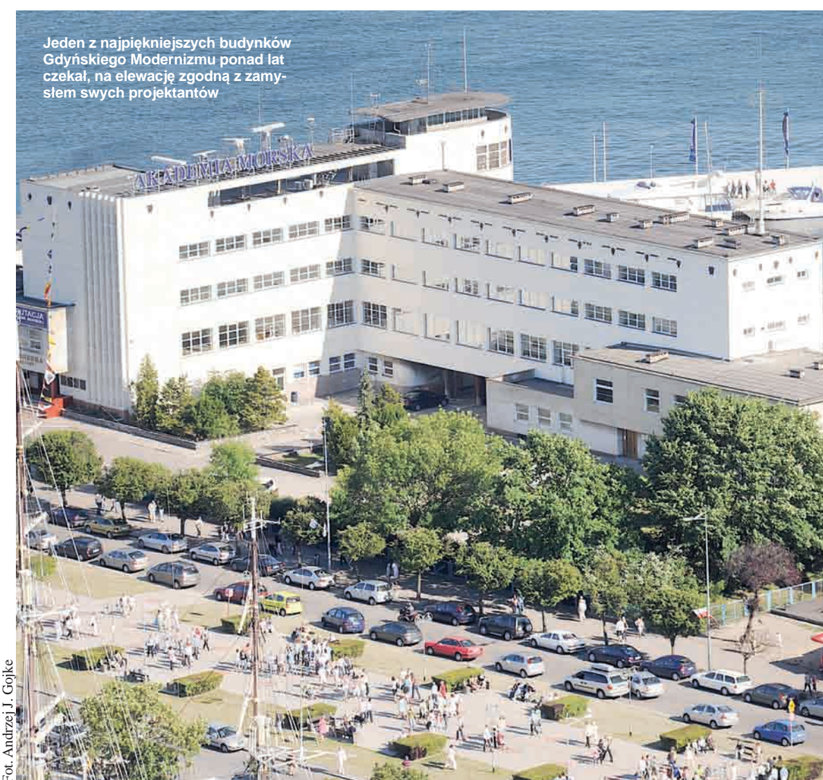
Fot. Andrzej J. Gójka