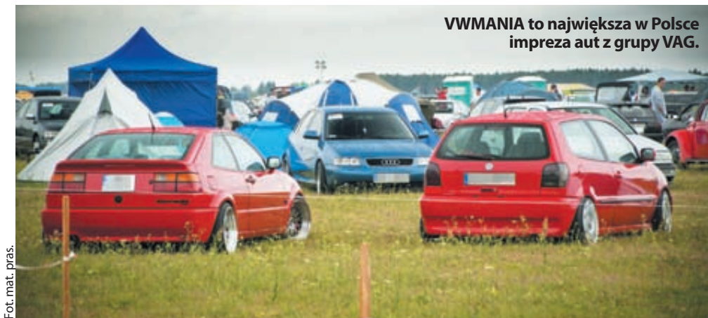
VWMANIA to największa w Polsce impreza aut z grupy VAG.

Tegoroczna edycja imprezy odbędzie się już po raz siedemnasty. Od piątku 31 lipca do niedzieli 2 sierpnia na lotnisku w Pruszczu Gdańskim będziecie mogli doświadczyć całej masy niezapomnianych atrakcji. Zawody Car Audio, podzielone na kilka kategorii konkursy Show & Shine, drift taxi, stunt motocyklowy czy wyścigi na dystansie 1/4 mili - to tylko niektóre z przewidzianych niespodzianek. Podobnie jak w roku ubiegłym piątkowy wieczór będzie należał do tych pieczołowicie wyselekcjonowanych perełek, które spotkają się na specjalnie dla nich zorganizowanym spotkaniu na terenie Międzynarodowego Bałtyckiego Parku Kulturowego Faktoria w centrum Pruszcza Gdańskiego. VIP Before Party będzie tłem dla profesjonalnej sesji zdjęciowej. Dodatkowo spośród tej wybranej grupy wyłonione zostanie pojazd, który otrzyma tytuł Auta sezonu VWManii 2015. Wieczorem pod eskortą policji uczestnicy spotkania w Faktorii przejadą w uroczystej paradzie przez miasto, prowadzącej na te-