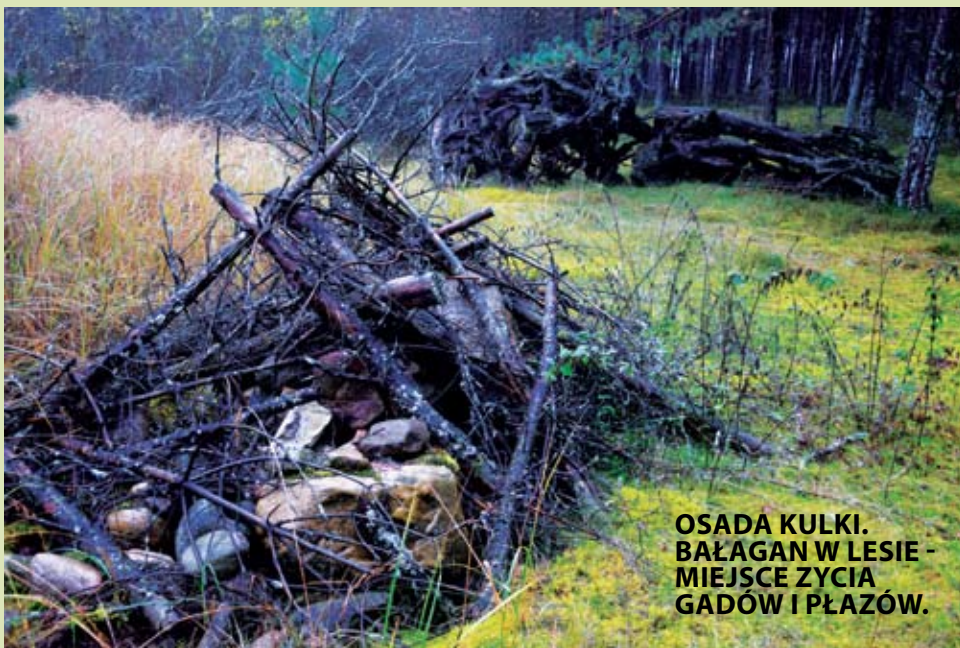
OSADA KULKI. BAŁAGAN W LESIE - MIEJSCE ŻYCIA GADÓW I PŁAZÓW.

Nic z tego. Nadzieje na pogodę okazują się całkowicie płonne. Od rana złośliwa aura zdaje się głośno śmiać z ambitnych planów poznawania Zaborskiego Parku Krajobrazowego. Czyli: leje nie mniej niż wczoraj.