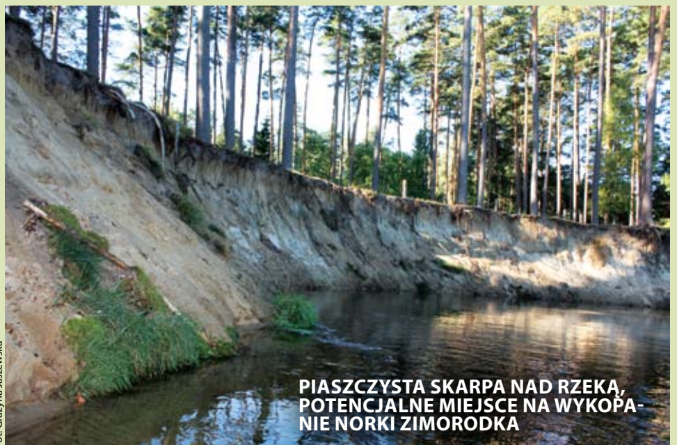
PIASZCZYSTA SKARPA NAD RZEKĄ, POTENCJALNE MIEJSCE NA WYKOPANIE NORKI ZIMORODKA

Śmiercionośne lęgniowce z portów nadmorskich przedostały się szybko do wód słodkich niemal w całej Europie, siejąc spustoszenie wśród rodzimych populacji raków. Wobec spadających dochodów z odłowów tych skorupiaków, pod koniec XIX wieku