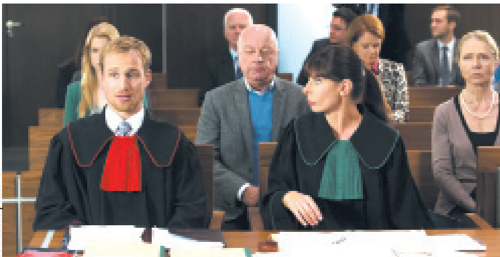
Bohaterowie filmu w szóstej serii

„Prawo Agaty” to jeden z najpopularniejszych polskich seriali. Gromadzi przed telewizorami ponad 2 miliony widzów.