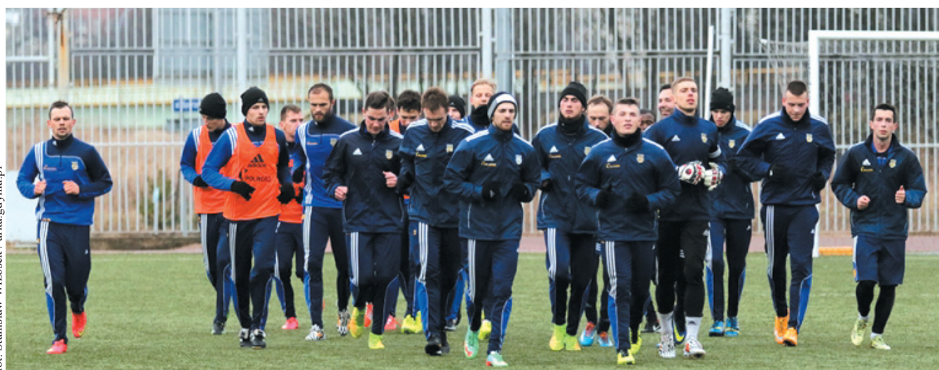
Zawodnicy Arki są w trakcie przygotowań do drugiej części sezonu

W poniedziałek gdynianie udali się na zgrupowanie do władysławowskiego Cetniewa, gdzie będą przygotowywać się przez kilka dni do rundy wiosennej.