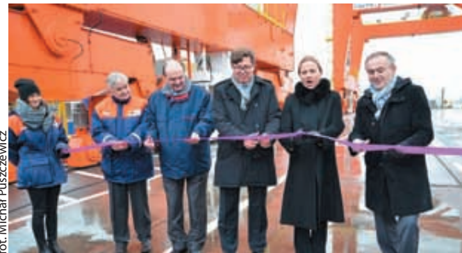
Oficjalna inauguracja nowych suwnic