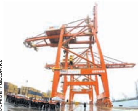
Gdynka może udźwignąć 60 ton