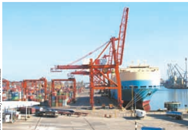
fort. Port Gdynia/T. Urbaniak

Kolejne istotne wydarzenia to m. in.: podpisanie przez PKP Polskie Linie Kolejowe S.A. umowy z WYG International Sp. z o.o. na opracowanie studium wykonalności wskazującego optymalny zakres modernizacji stacji kolejowej obsługującej port morski w Gdyni, przekazanie do użytkowania nowego magazynu wysokiego składowania przy ulicy Kontenerowej 27 w Gdyni, podpisanie umowy zbycia 100% udziałów spółki BTDG – Bałtyckiego Terminalu Drobnicowego Gdynia Sp. z o.o. na