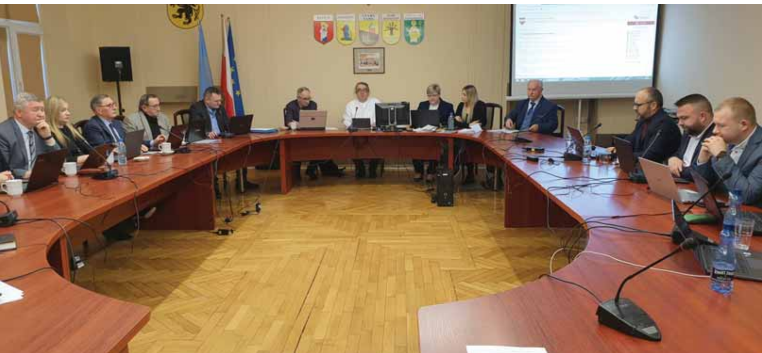
Sesja powiatu sztumskiego odbyła się 25 stycznia 2023 roku.

Radni powiatu przegłosowali uchwałę o zawarciu porozumienia i wyrażeniu zgody na bezprzetargową dzierżawę szpitala w Sztumie. Potencjalny operator, z którym prowadzone są negocjacje, czyli spółką American Heart of Poland, która zapowiada inwestycje na poziomie 100 milionów złotych.