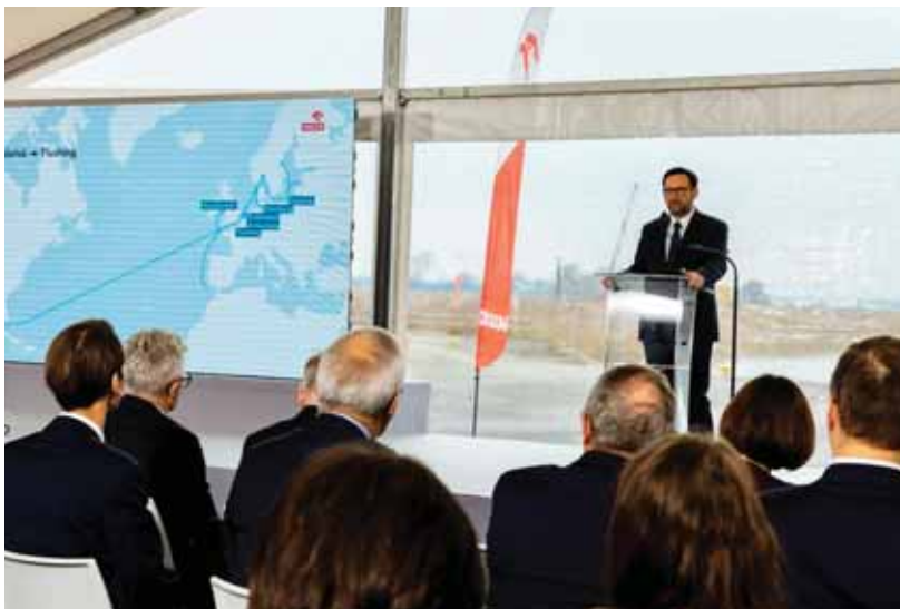
Inwestując we własną infrastrukturę, zwiększamy niezależność od partnerów zewnętrznych - przekonuje Daniel Obajtek, prezes Grupy Orlen.

Docelowe moce przeładunkowe morskiego terminala zlokalizowanego na Martwej Wiśle w kolejnych latach mogą wynieść nawet do 2 milionów ton produktów rocznie. Realizacja inwestycji poprawi rentowność i bezpieczeństwo dostaw biokomponentów do produkcji paliw (biobenzyny i biodiesela) oraz transportu produktów (olejów bazowych i paliw żeglugowych) powstających w rafinerii. Terminal odciąży też funkcjonującą na terenie zakładu bocznice kolejową, bo to właśnie tą drogą